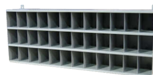
Кассетница для хранения символов