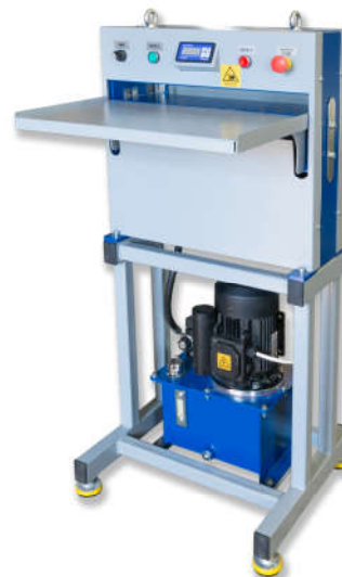
Пресс ПГС-30Ш с подставкой