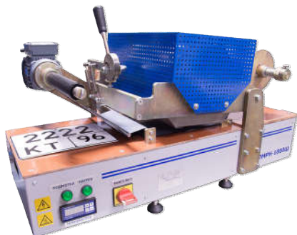
Машина покрасочная ПМРН-1000Ш